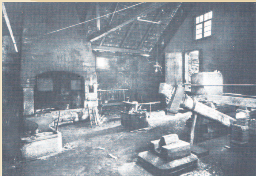
◀ ▲ Der „Guttenberger Hammer“ mit Hammer und Amboss auf historischen Fotos aus dem Familienbesitz.