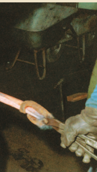
Eine Spitzhacke auf dem Weg zur Vollendung.

Der Rasenrechen hat 20 Zinken und einen Stiel aus hartem Eschenholz. Trotzdem ist er mit 600 g ein Leichtgewicht.